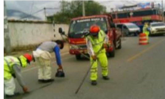
FIGURA 1: DESCRIPCIÓN